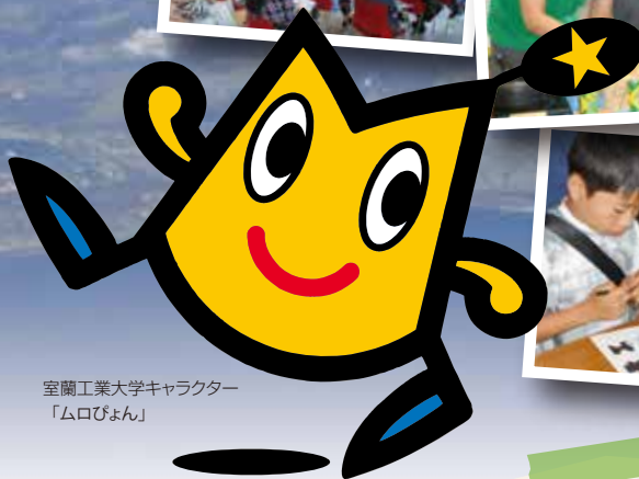
室蘭工業大学キャラクター 「ムロびよん」

7月8日(土)・9日(日) ●8日(土) 13:00~18:00 ●9日(日) 10:00~16:00